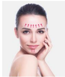
Front et mâchoire