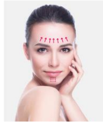
Voorhoofd en kaak